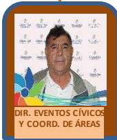
DIR. EVENTOS CIVICOS Y COORD. DE AREAS