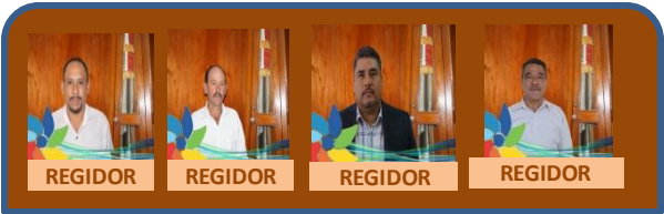
REGIDOR REGIDOR REGIDOR REGIDOR