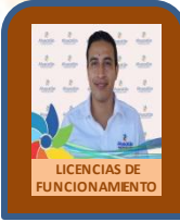
LICENCIAS DE FUNCIONAMIENTO