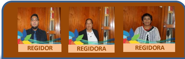
REGIDOR REGIDORA REGIDORA